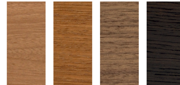
Noce Italiano Biondo Teak Gold Noce Canaletto Rovere thermo