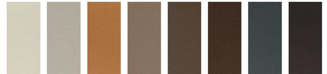
C23 Ghiaccio C01 Silver C39 Sella C29 Taupe C28 Fango C31 Tabacco C18 Grafite C32 Caffè