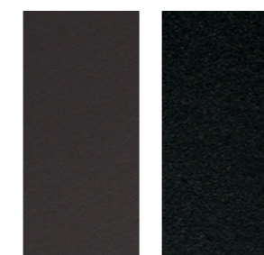
C11 Moka C09 Nero